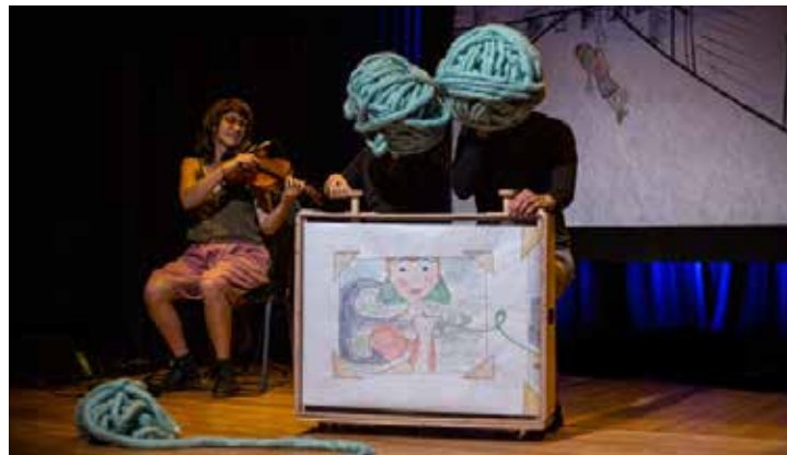
Photo : Spectacle pour enfants et leurs parents : Nora la trotteuse

Les membres du comité culturel préparent actuellement la programmation de la nouvelle année. Trois spectacles sont prévus à l'horaire, dont un pour les enfants et leurs parents, un autre grand public à l'extérieur ainsi qu'un troisième pour les adolescentes et les adolescents et les adultes. Toutes et tous les artistes de ces trois spectacles, en processus de confirmation, habitent la région de l'Estrie et sont des personnes très créatives. De belles découvertes à venir! Le concert des élèves de Nelligan Tétrault revient au début de l'été et celui de la musique classique d'Orford sur la route sera de retour en juillet. Enfin, la chorale Le Cœur de Saint-Denis présentera son tout nouveau spectacle au printemps. Une projection d'un film pour toute la famille est également dans les cartons. D'autres activités sont en préparation, dont une première exposition à la bibliothèque.