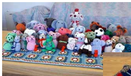
Collection de tousus Tuques, foulards, mitaines

Ci-dessous, les réalisations du groupe des tricoteuses pour offrir aux nouveaux arrivants