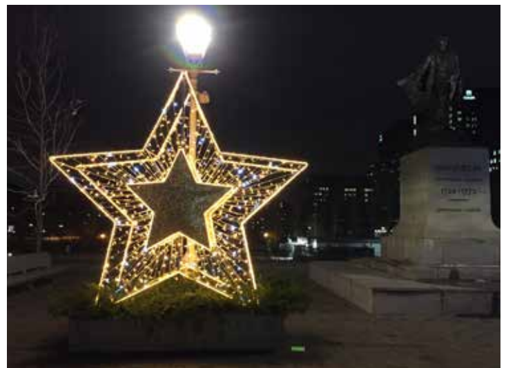
Place Vauquelin à Montréal