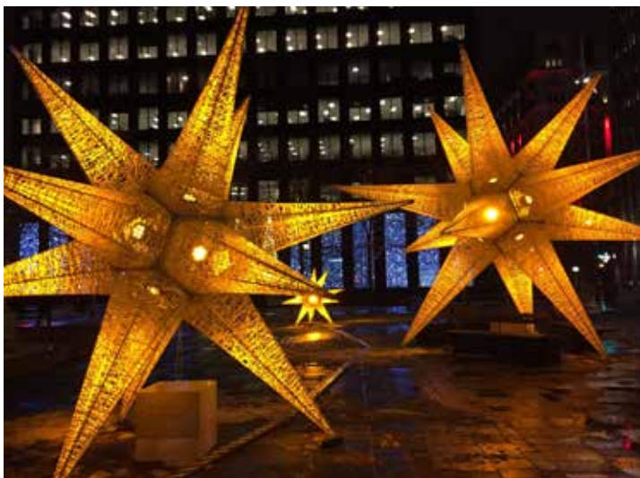
Place d'Armes à Montréal